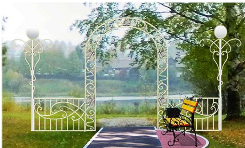
Рисунок 6. Арка на пляж, оформление «карманов» на аллее