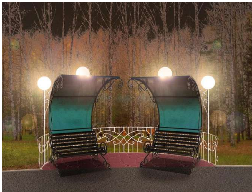
Рисунок 5. Освещение «карманов» у сцены