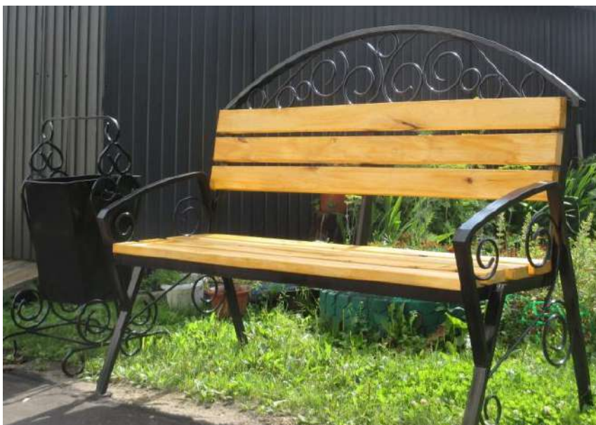
Рисунок 4. Скамьи парковые