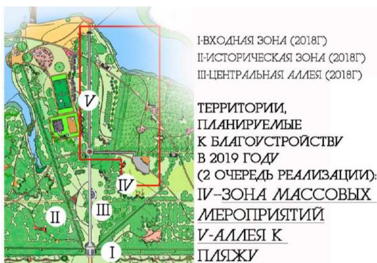
Рисунок 1. Размещение территории, планируемой для благоустройства в 2019 году в плане парка

По-прежнему актуальной задачей остается решение вопроса возможности концертов и торжественных мероприятий (в том числе, Дня поселка) на территории Заречного парка. Для этого крайне необходима организация зоны массовых мероприятий и устройство сцены. Требуется также логически завершенное решение центральной аллеи парка. Эти задачи планируется решить в 2019 году. Также планируется продолжить благоустройство центральной аллеи парка с выходом к территории пляжа, выполнить благоустройство территории массовых мероприятий с устройством танцевальной площадки и сцены.