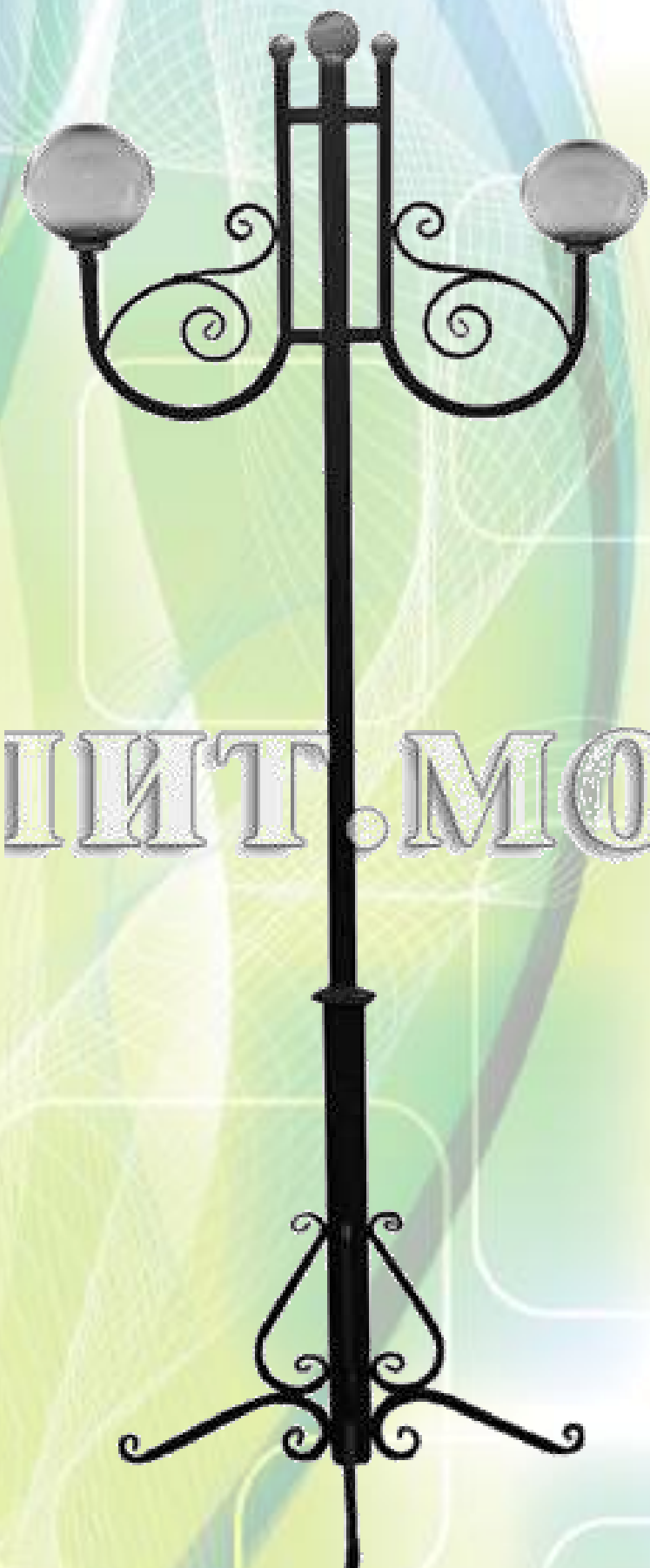
Столб фонарный кованый