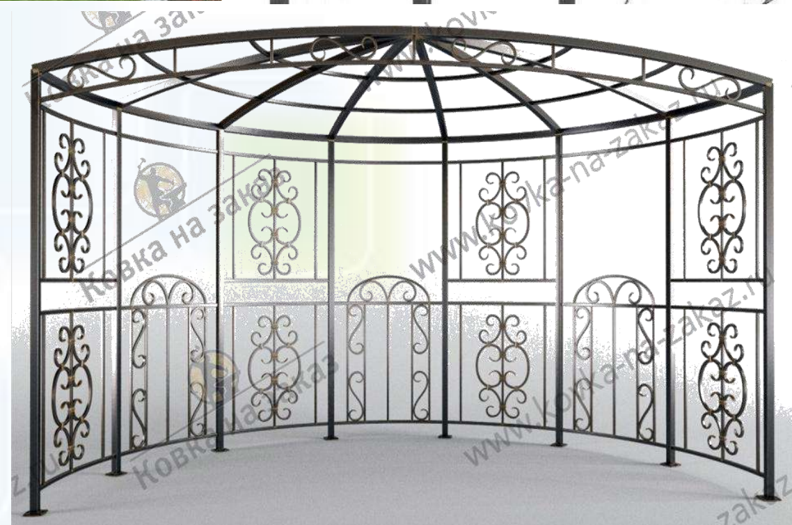
Элементы ковки для перголы